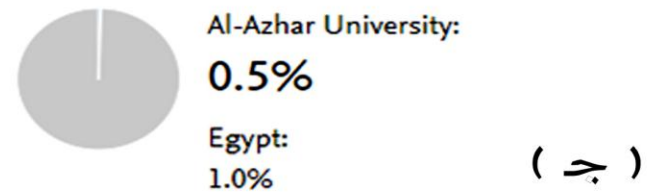
( شكل ٢ )

Publications with both academic and corporate affiliations