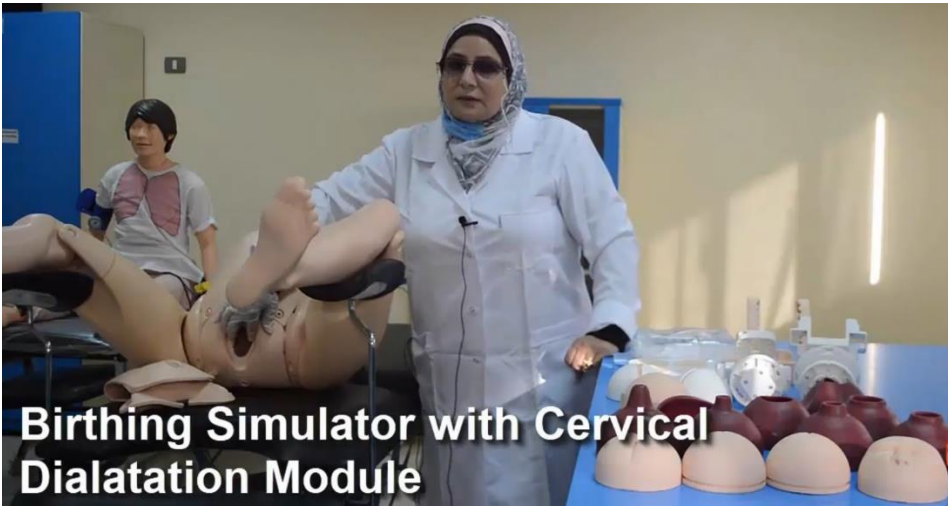
Birthing Simulator with Cervical Dilatation Module

13- بداية عام 2021-2022 تم عمل فيديو توضيحية للطالبات على عمل procedures بالنسبة لقسم طب الاطفال وقسم الجراحة وتدريب الطالبات على كل المانيكانات المعنية في كل اسبوع عدد 8 اسابيع مقسمين على 8 معامل اسبوعيا بمعدل ساعتين لكل معمل مقسمين على 4 مجموعات لكل ساعة يقوم بالتدريب 8 اعضاء هيئة تدريس لكل يوم